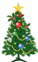
TABLEAU DES CULTES : ☉ = Ste Cène

Ils ont lieu à 10h30 sauf avis contraire